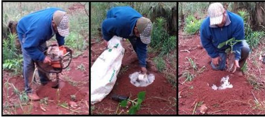
Imagen 1: Plantación de kiri (hoyado, colocación de cal, plantación).