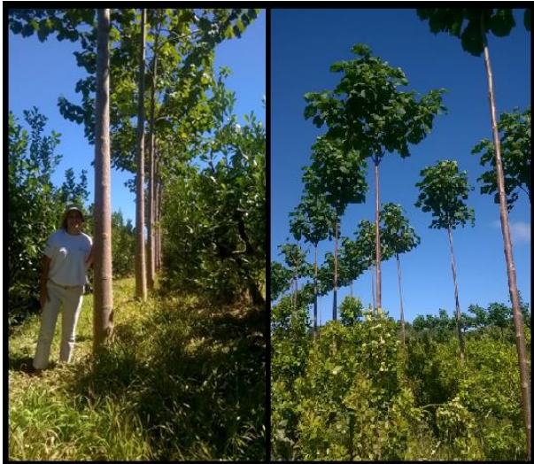
Imagen 3 – Marco de plantación para cortinas simple y doble, de kiri en la provincia de Misiones.

En otros países se evaluaron densidades de 2000 a 2500 pl/ha cuando el objetivo fue la producción de biomasa para energía.