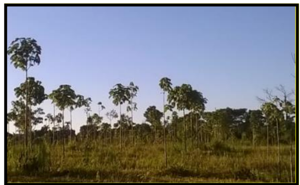
Imagen 2 – Plantación de Kiri en macizo, en la provincia de Misiones.

por luz. Esta consociación generalmente se realiza en cortinas de líneas simples o dobles (Imagen 3), separadas entre sí por calles de 25 m. Tanto en cortinas de líneas simples como dobles el distanciamiento entre plantas en la línea es de 4 m, mientras que en el caso de las dobles se utiliza una distancia entre líneas de 5 m.