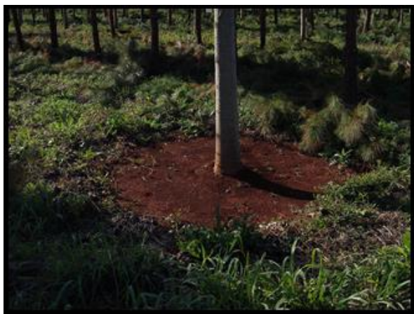
Imagen 6. Carpida para control de malezas en plantaciones de kiri en la provincia de Misiones.

daños ocasionados por fitotoxicidad son irreversibles.