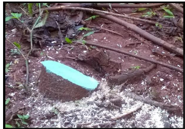
Imagen 4 – Descepe de kiri en la provincia de Misiones.

Las experiencias sugieren realizar el descepe solamente cuando el diámetro a nivel del cuello de la planta sea mayor a los 2 cm.